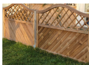
Staket med spaljé

Alla typer av häck och staket ska ha en öppning eller grind mot allmänning eller gångväg.