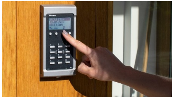
BESÖKARE RINGER UPP VIA DISPLAYEN